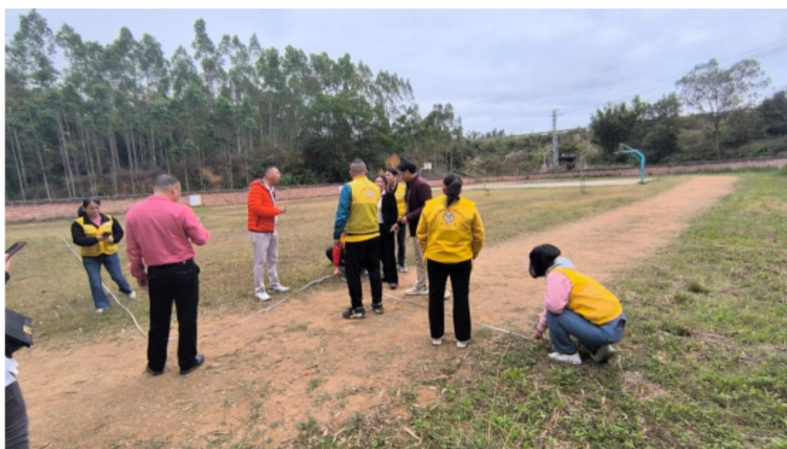
图 1: 高州旺坑小学改造前图片